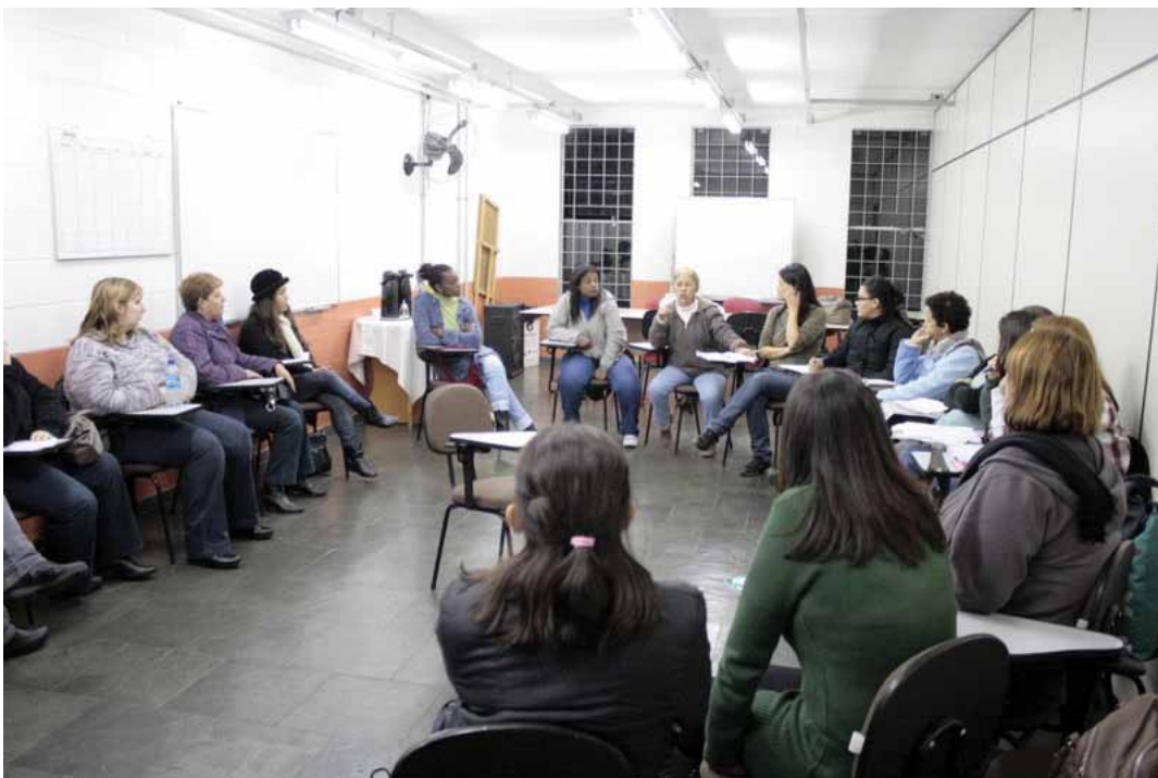
Reunião da Educação realizada dia 10/06/11