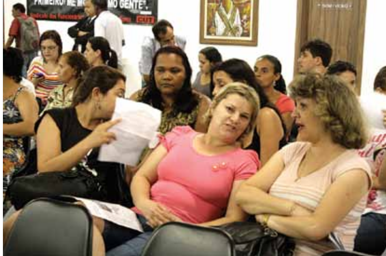
Professores/as participam da votação do Estatuto do Magistério

Os/as professores/as sócios/as do Sindicato que continuarem ameaçados de desconto devem procurar a entidade para fazer valer os seus direitos.